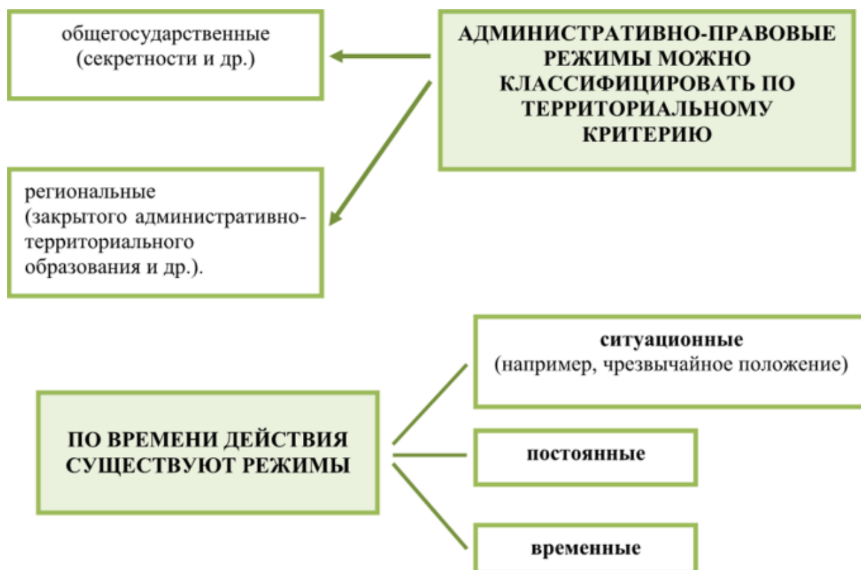
Рисунок 3.1 – Виды административно-правовых режимов