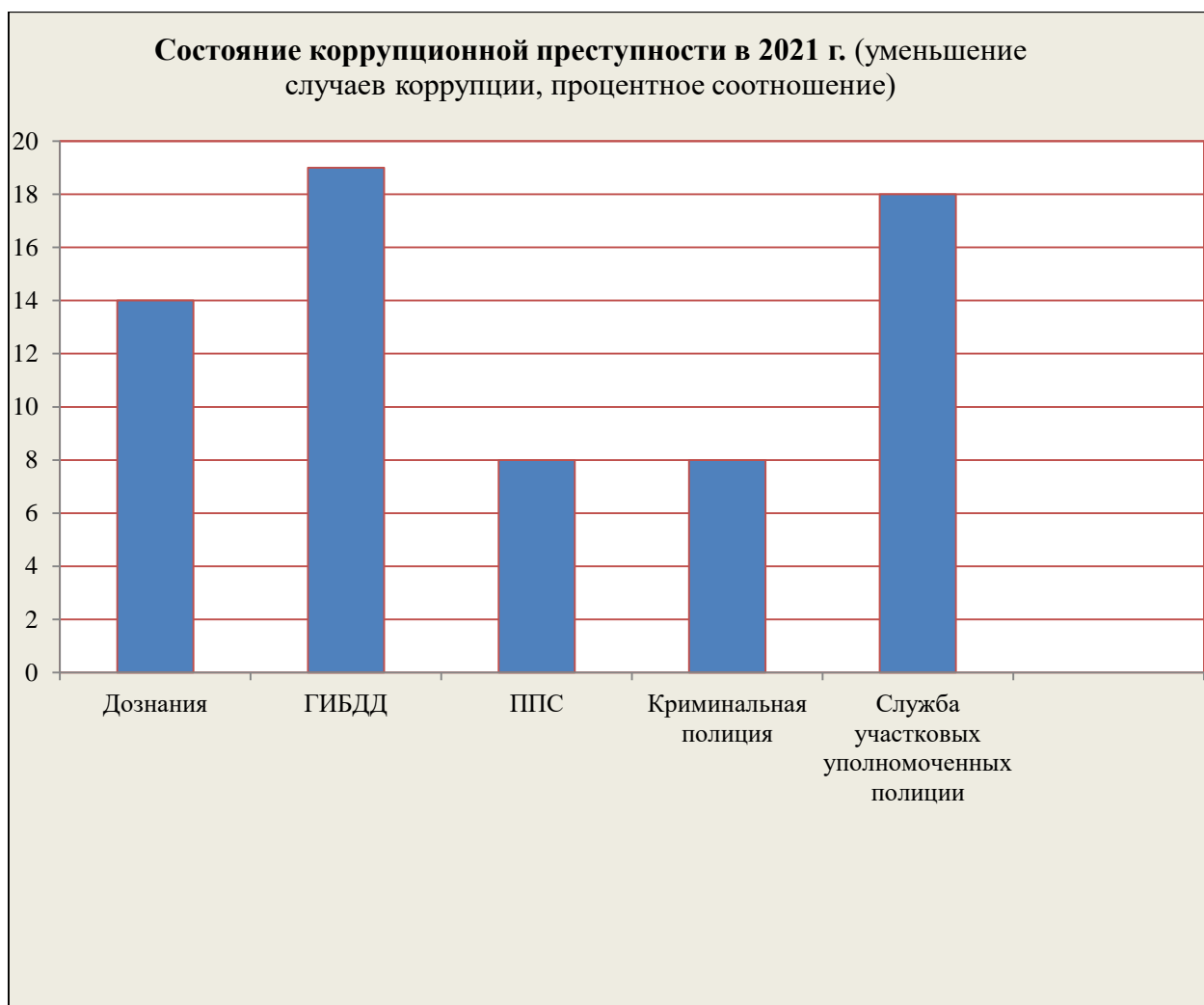
Рисунок 2.1 – Уменьшение случаев коррупции за 2021 год